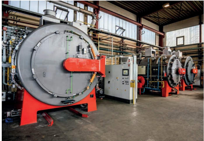
[ Nitrierkammeröfen: Ausbau der Serienfertigung. ]

Ein neuer Schachtofen mit Nutzmaß \emptyset 2900 x 5500 mm ermöglicht das Nitrieren von großen Werkstücken bis 50 t Stückgewicht. Zusätzlich erweitern neue Kammeröfen unsere Nitrierkapazitäten im Bereich der Serienfertigung.