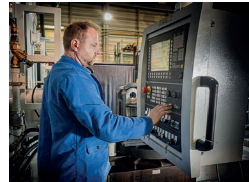
[ Prozessregelung, Überwachung und Dokumentation auf dem neusten Stand der Technik. ]