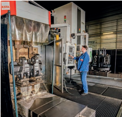
[ Induktivhärten von Kettengliedern. ]